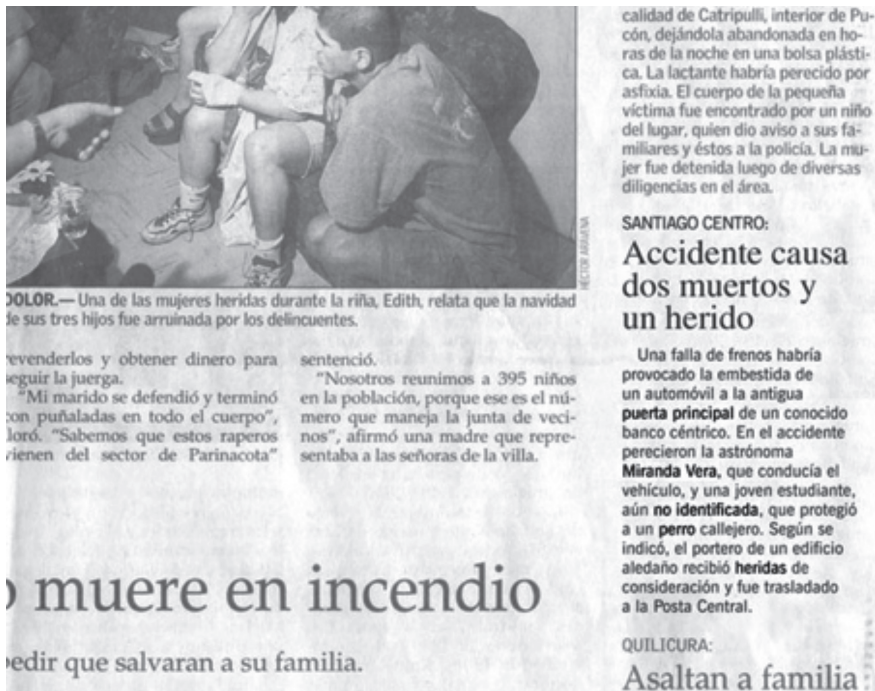
Imagen 1. Interfaz principal de Pentagonal: Incluidos tú y yo . Las palabras destacadas con negrita constituyen enlaces, pudiendo comenzar la lectura por cualquiera de ellos.

posibilidades de comenzar a explorar el texto. El lector puede comenzar su lectura por cualquiera de estos enlaces, los que se multiplican a través de la existencia de otros hipervínculos existentes dentro de los bloques de texto que se presentan al avanzar en el hipertexto.